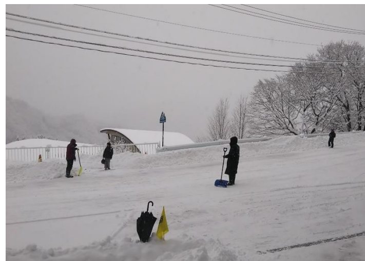
雪かき・交通安全ボランティア