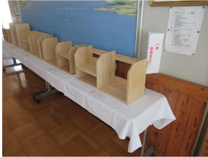
中1 技術作品 本立て