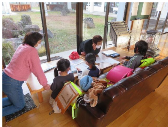
放課後学習ボランティア