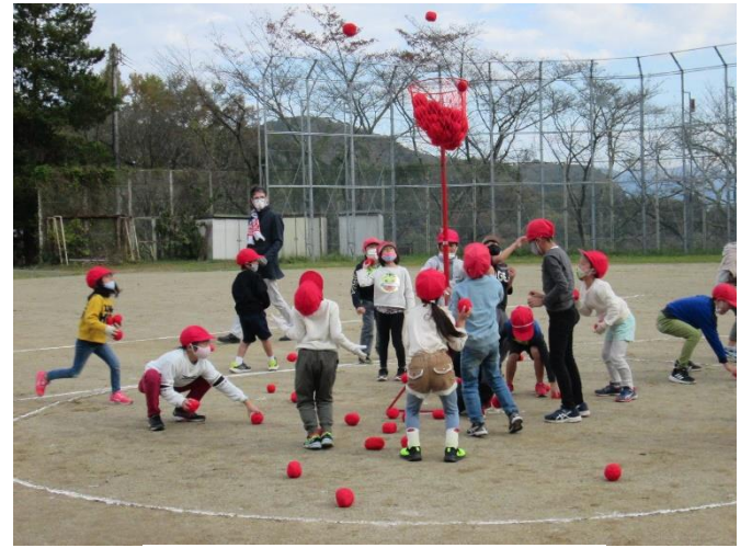
児童会 なかよし集会