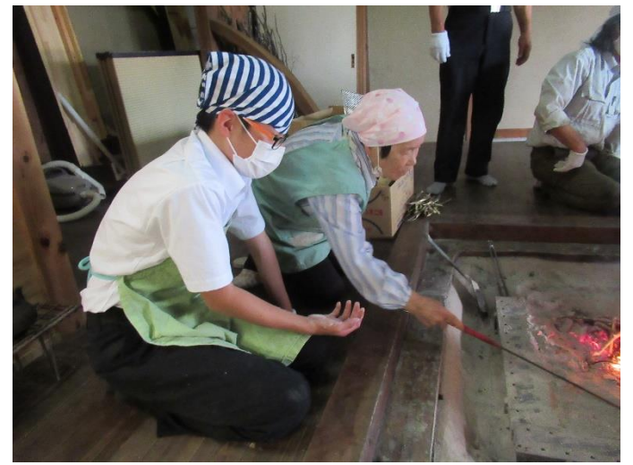
総合的な学習の時間 やさか人間塾