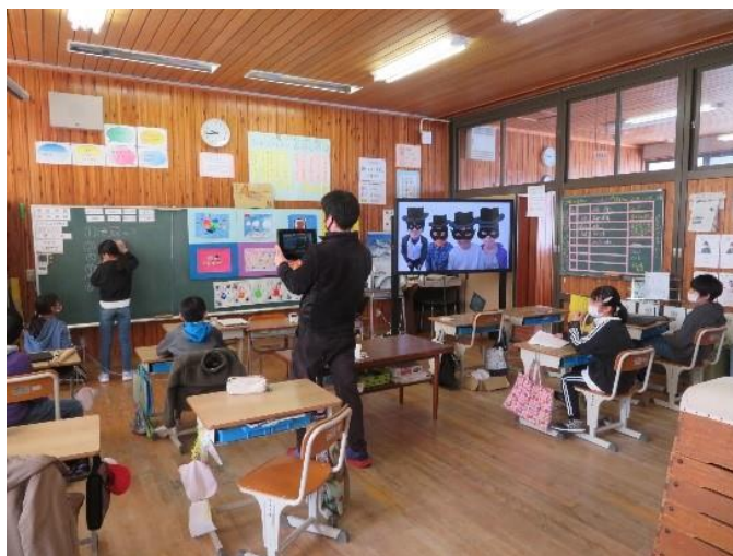
オンライン土曜授業参観（学習発表）