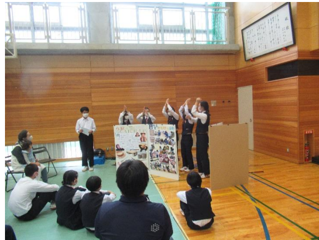
総合的な学習の時間発表