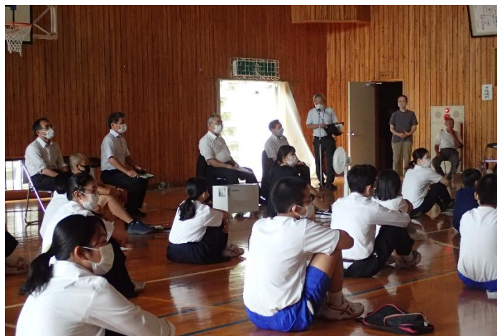
人権を考える市民の集い