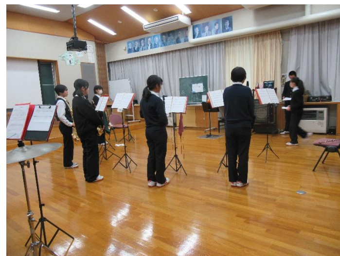
アンサンブルコンテスト壮行会 （オンラインで実施）