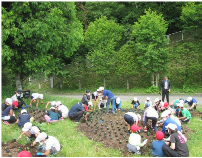
小学校 花壇定植作業