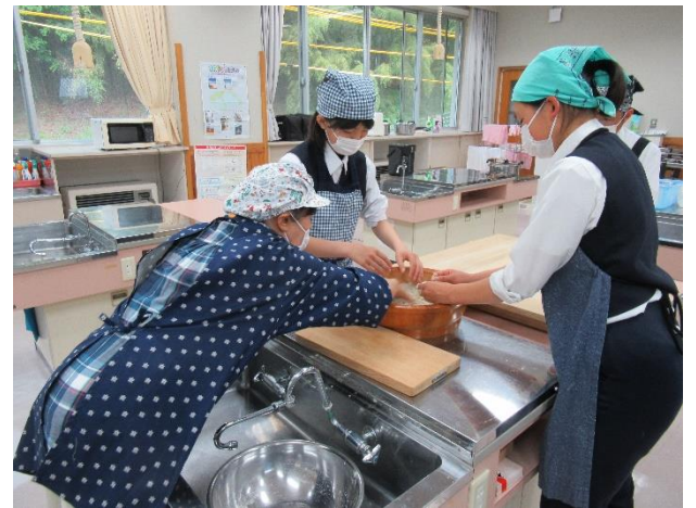
総合的な学習の時間 やさか人間塾