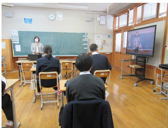
校長講話（オンライン）