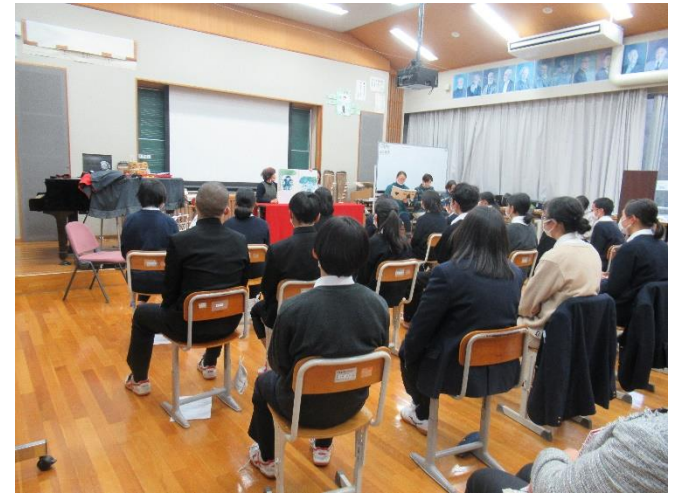
お話カリヨン 読み聞かせの会