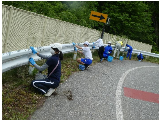
39年間続くガードレール磨き