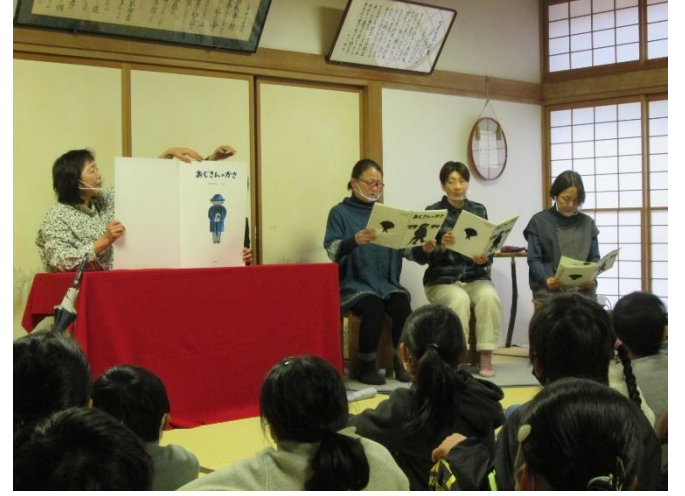
お話カリヨン 読み聞かせの会