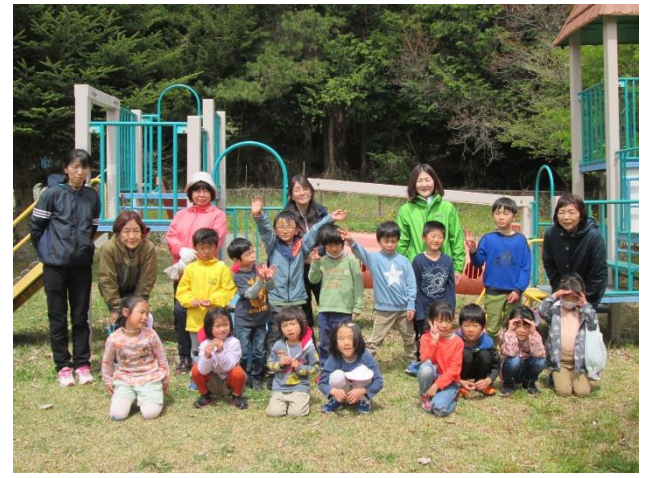
小1・2年遠足 切久保グラウンド