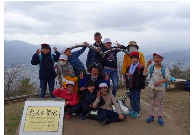
小3・4年遠足 鷹狩山