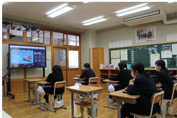
職業講話（オンラインで実施）