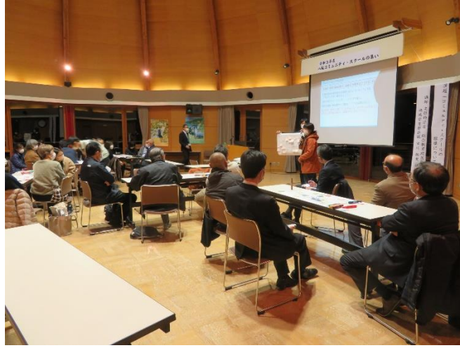
コミュニティ・スクールの集い