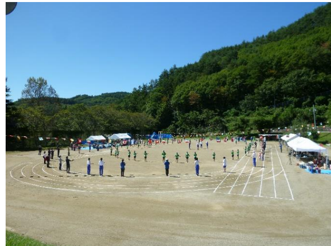
八坂ふれあい運動会