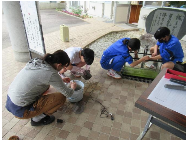
学校、PTA、地域一丸の環境整備