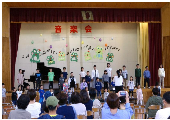
音楽会 歌・演奏指導