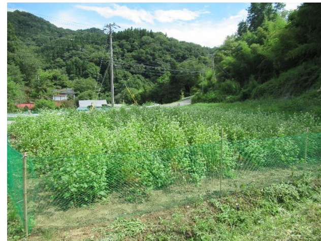
そば学習（成長したそば）