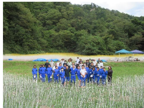
北アルプス国際芸術祭 制作ボランティア