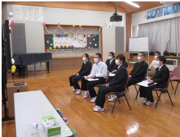
中学校 3年生を送る会