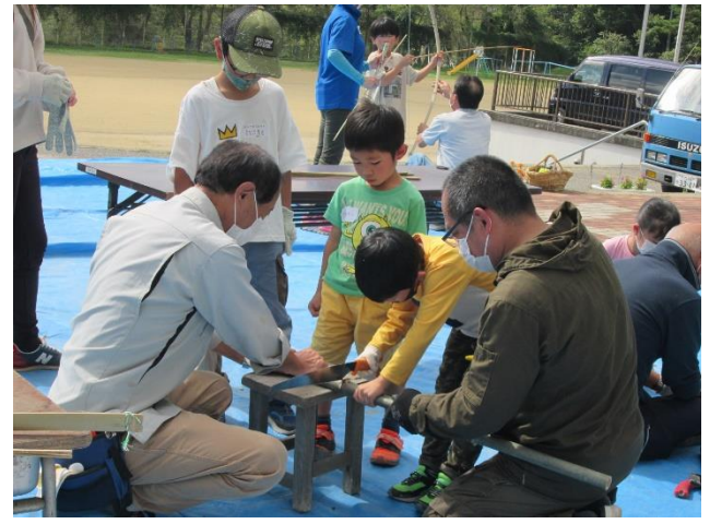
郷土ふれあい体験学習