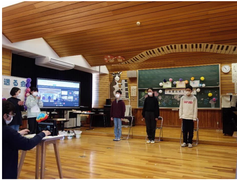
小学校 6年生を送る会